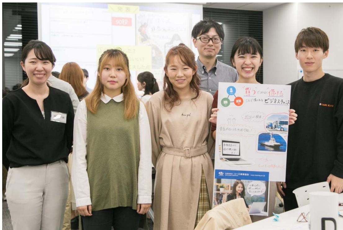
「“買う”ではなく“借りる”ことで得られるビジネスチャンス」

「不要になった設備を処分するとき、廃棄もリース会社におまかせできる」など、利用者の疑問を解消できるポスターに。「事務用品から飛行機や船まで！」というコピーも印象的。そう、飛行機や船などもリースできてしまうのです！