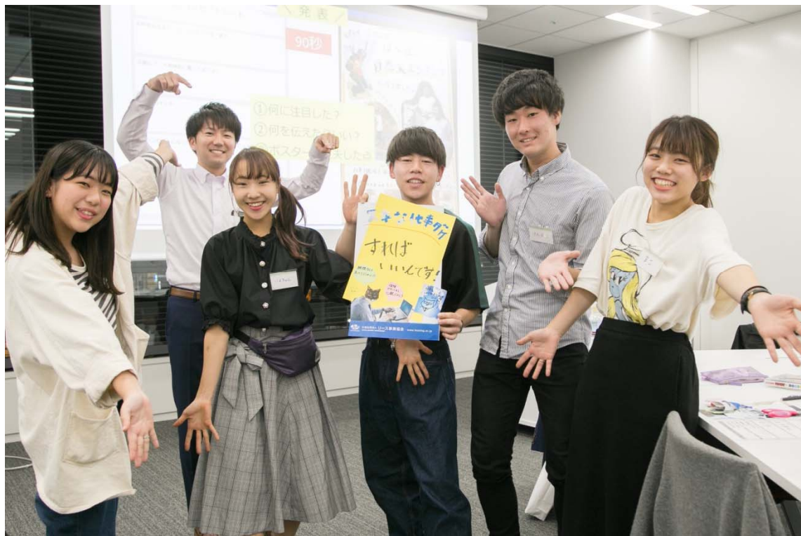
「スキな仕事ダケすればいいんです！」

こちらは起業を考える若者に向けたポスター。起業には不安がつきものですが、リースによって、自分のやりたいことに安心して集中できること、費用面の悩みを解消できることをわかりやすく伝えています。