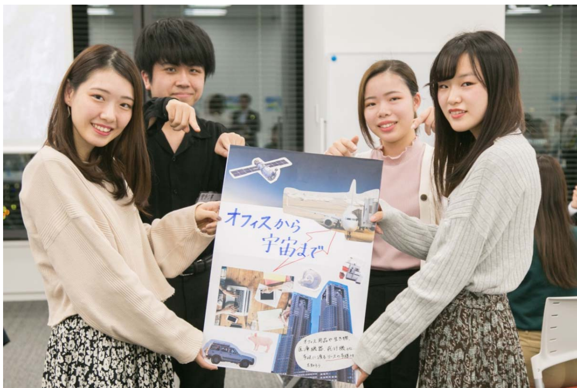
「オフィスから宇宙まで」

コピーに「宇宙」というワードを織り込み、リースの多様性をアピール。ふだんの仕事に欠かせない基本アイテムから、医療機器などの専門性の高いものまで、いろいろなものをリースできることを表現しています。