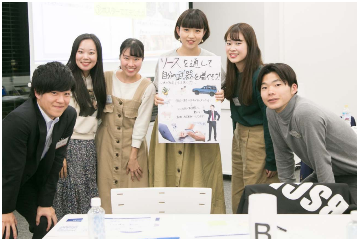
「リースを通して自分の武器を増やそう ~現代社会を生き抜く力~」

「就活生向け」という着眼点がユニーク。リース会社は業界・業種を問わずにあらゆる企業と取引しているからこそ、幅広い知識が欠かせません。リース業界で働くことで視野が広がり、社会人として成長できる環境であることをアピール。