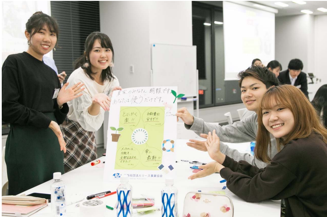
「農家のみなさん 朗報です。あなたは“使う”だけです」

ターゲットを第一次産業に従事する人びとにしぼり込んだAチーム。「各種手続きやメンテナンスをリース会社にまかせられる」「購入よりも費用を抑えられる」など、リースならではのメリットをたっぷりと盛り込みました。