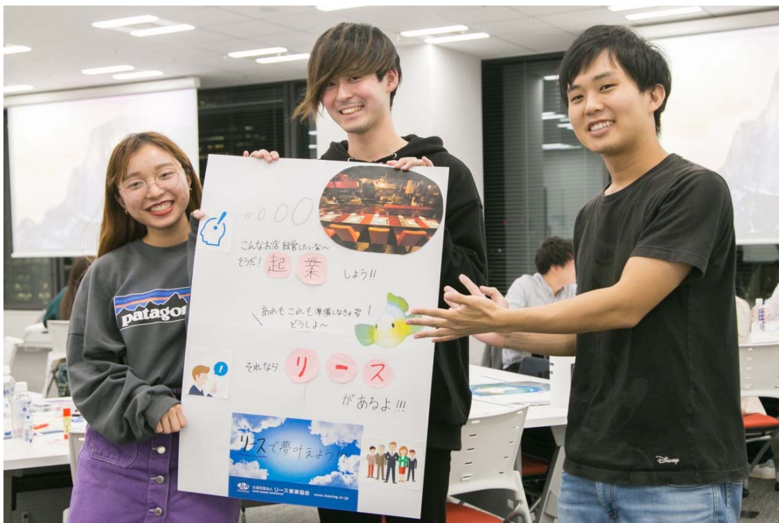
「リースで夢 叶えよう!!」

学生のうちに起業をめざす、ベンチャー精神旺盛な学生をターゲットにしたポスター。やりたいことや目標はあるけれど、費用がネックでチャレンジできずにいるとき、リース会社が夢の実現をサポートしてくれることを伝えています。